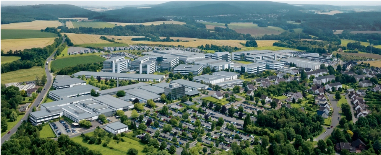
Phoenix Contact Deutschland GmbH